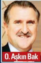
O. Aşkın Bak

G ENÇLERE barınma imkânı sunmanın yanı sıra onları maddi açıdan da destekleyen Gençlik ve Spor Bakanlığı, burs/kredi başvurularını almaya başladı. Bakan Osman Aşkın Bak , sosyal medya hesaplarından yaptığı duyuruyla 2024-2025 eğitim öğretim dönemi için burs/kredi başvurularının başladığını bildirdi. 2024-2025 eğitim öğretim yılında ilk defa bir yükseköğretim programına girmeye hak kazanan öğrenciler, halen bir yükseköğretim programına devam eden ara sınıf öğrencileri ve yurtdışında öğrenim gören Türk vatandaşları, burs/kredi başvurusunda bulunabilecek.